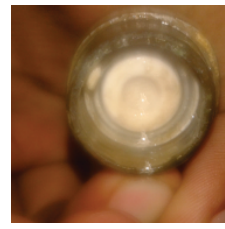
૪૫ દિવસ પછી